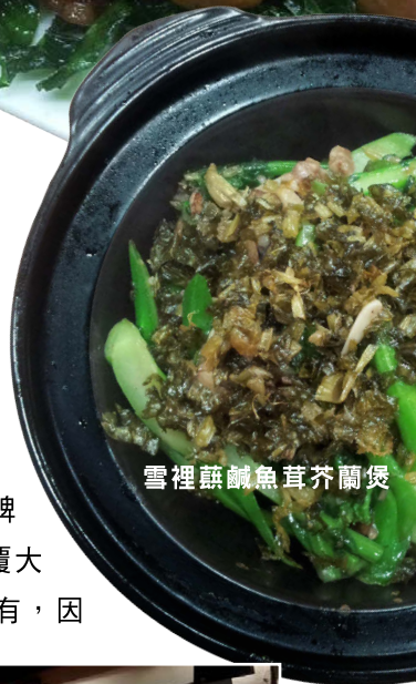
雪裡蕪鹹魚茸芥蘭煲