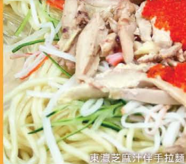
東瀛芝麻汁伴手拉麵