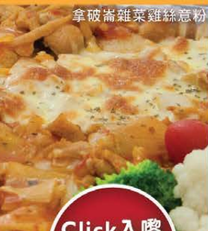
拿破崙雜菜雞絲意粉